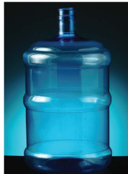
بطری آب ساده