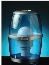
بطری آب تصفیه دار